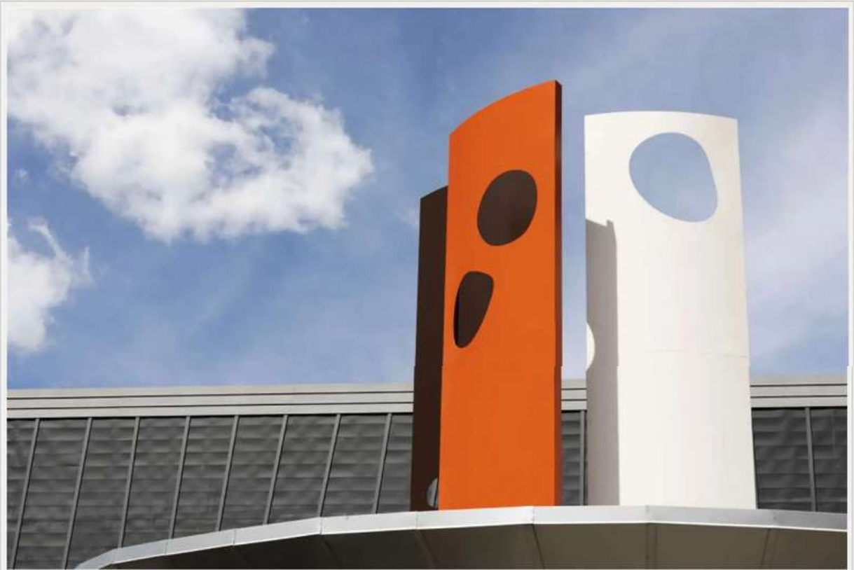
Parco Archeologico dell'Area Megalitica di Aosta