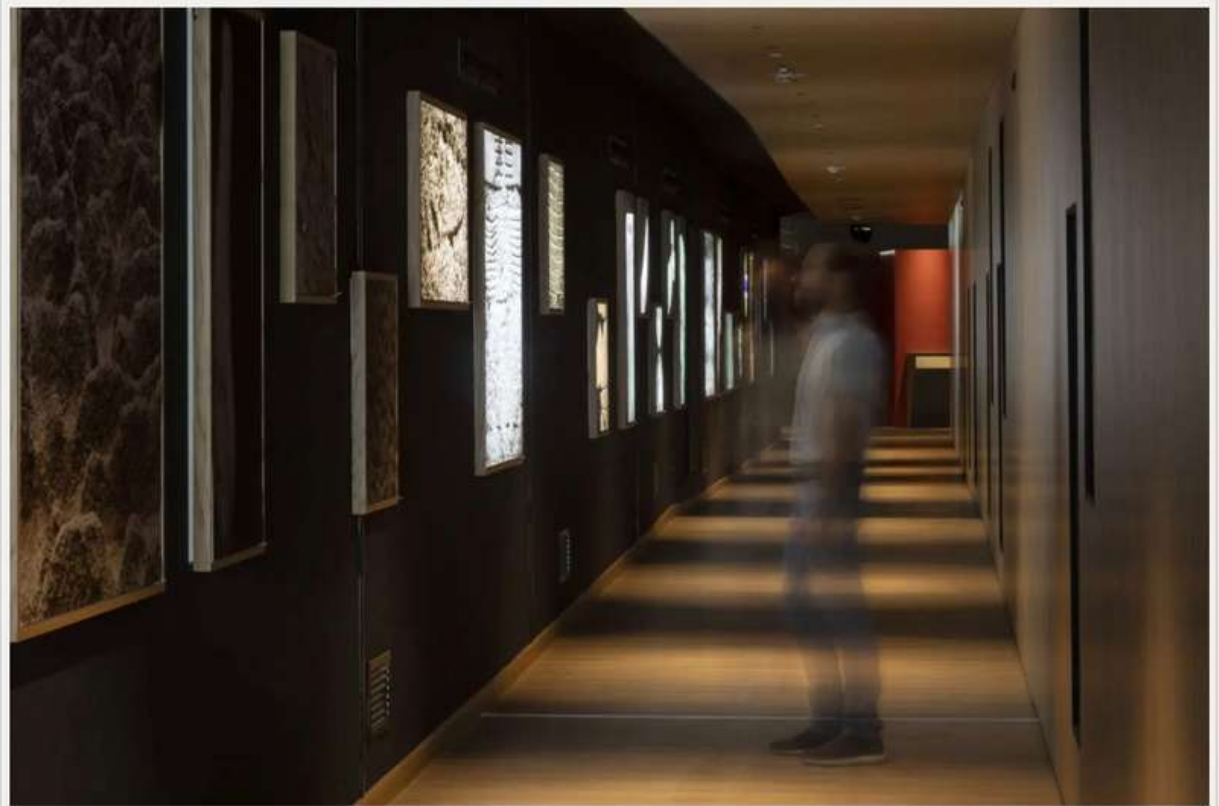
Parco Archeologico dell'Area Megalitica di Aosta