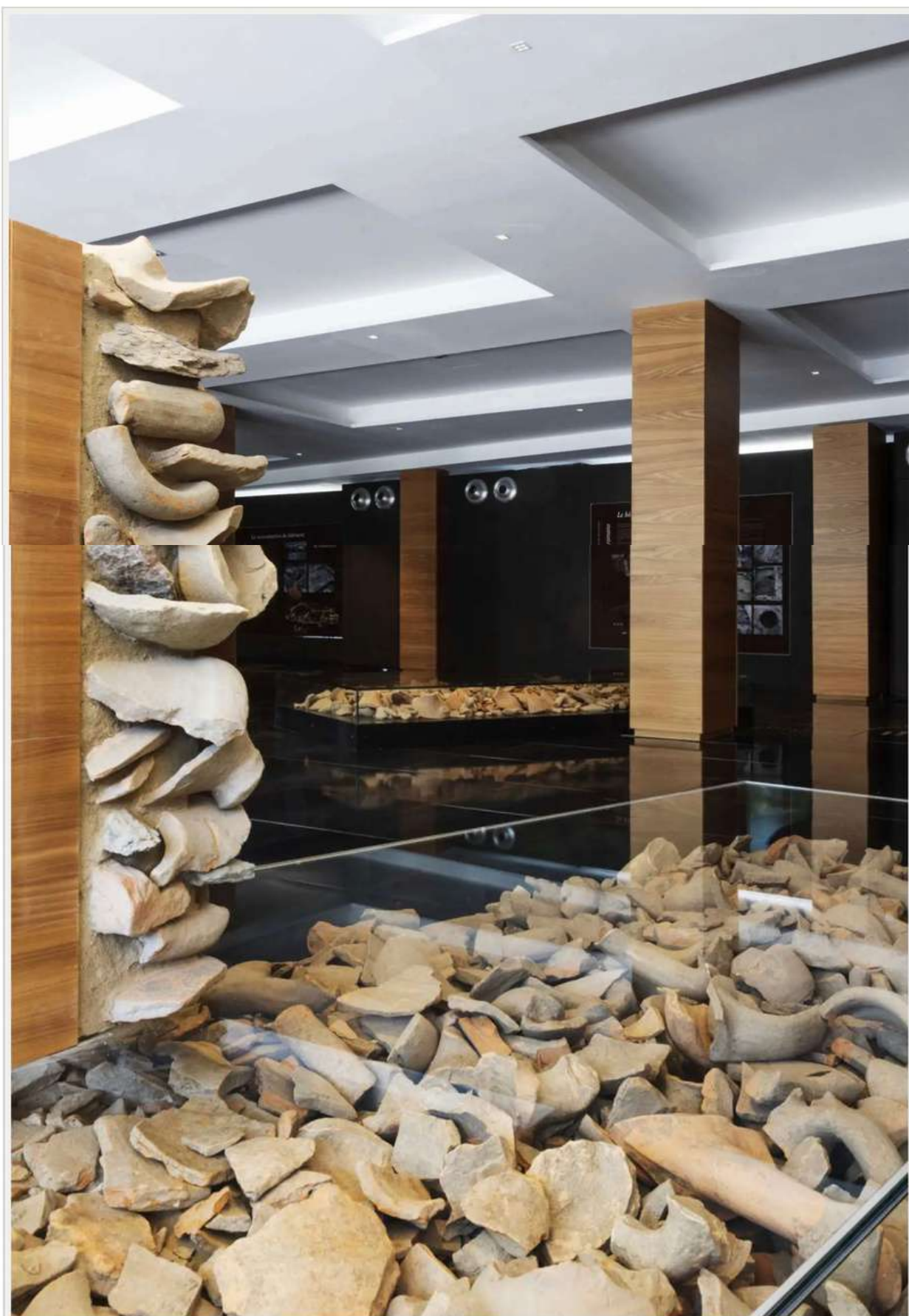
Parco Archeologico dell'Area Megalitica di Aosta